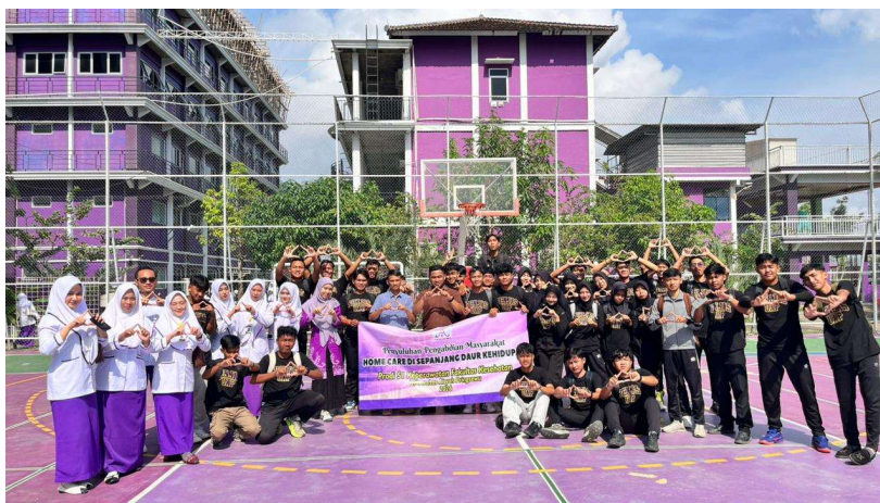
Gambar 1. Dokumentasi Kegiatan

Bagian ini Kegiatan penyuluhan kesehatan tentang pencegahan penyalahgunaan NAPZA pada mahasiswa Penjas semester 2 di Universitas Aisyah Pringsewu berlangsung dengan baik dan mendapat respons positif dari peserta. Selama kegiatan berlangsung, mahasiswa terlihat aktif mengikuti penyampaian materi, memperhatikan penjelasan pemateri, serta terlibat dalam sesi diskusi dan tanya jawab. Antusiasme peserta menunjukkan bahwa materi mengenai penyalahgunaan NAPZA merupakan topik yang menarik dan relevan bagi mahasiswa.