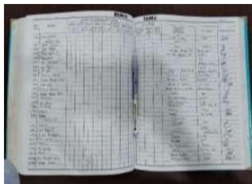
Gambar 3. Pencatatan buku tamu yang masih dilakukan secara manual

Berdasarkan observasi, proses pelayanan di perpustakaan masih di dominasi oleh sistem manual. Pencatatan buku tamu menggunakan buku tulis dan tidak terintegrasi dengan sistem komputerisasi. Hal ini berpotensi mengakibatkan kehilangan data, kesalahan pencatatan, serta kesulitan dalam melakukan rekapitulasi jumlah kunjungan (Anggraini, 2022). Proses manual juga ditemukan pada beberapa aktivitas sirkulasi seperti pencatatan peminjaman yang masih menggunakan formulir tertulis.