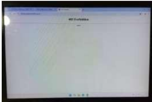
Gambar 2. Tampilan OPAC yang masih sederhana dan tidak responsif pada perangkat mobile

perpustakaan modern, koleksi digital merupakan elemen penting untuk menarik minat generasi muda dan menyediakan variasi sumber informasi yang lebih luas (Satria, 2022).