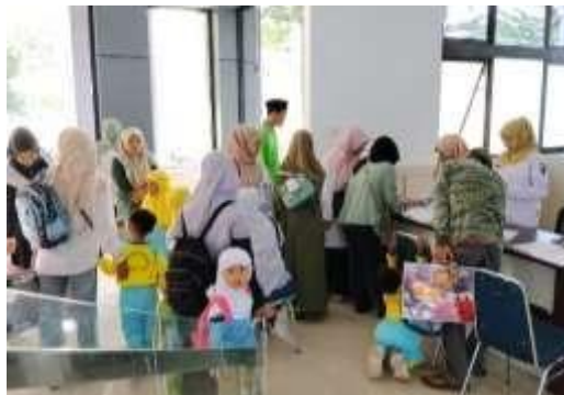
Gambar 4. Situasi pelayanan manual yang menimbulkan antrian

kemampuan mereka dalam melakukan tugas teknis seperti klasifikasi koleksi, katalogisasi, dan layanan referensi (Suryani, 2021). Ketidaksesuaian kompetensi terlihat dari beberapa kesalahan penempatan buku, pelayanan yang kurang ramah, serta kurangnya pemahaman terhadap teknologi perpustakaan.