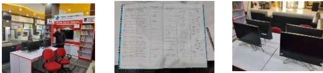
Gambar 8. Kondisi Pojok Baca Digital yang tidak berfungsi

Selain permasalahan teknis, Pojok Baca Digital (POCADI) juga tidak memiliki petugas khusus yang mendampingi pemustaka dalam mengoperasikan perangkat digital. Kurangnya SDM kompeten menyebabkan pengguna kesulitan memahami cara menggunakan fasilitas digital, sehingga memilih kembali layanan yang masih manual. Ketidaksiapan SDM ini selaras dengan temuan penelitian sebelumnya yang menyatakan bahwa literasi digital di perpustakaan sangat bergantung pada kesiapan pustakawan dalam mendampingi pengguna (Dewi, 2021). Tanpa pendampingan, fasilitas digital tidak dapat dimanfaatkan secara optimal.