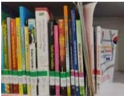
Gambar 5. Penataan koleksi yang tidak sesuai dengan nomor rak atau klasifikasi

Observasi pada ruang koleksi menunjukkan bahwa beberapa buku tidak ditempatkan sesuai dengan nomor klasifikasi atau nomor rak buku yang seharusnya. Hal ini menyebabkan pemustaka kesulitan mencari buku secara mandiri (Lestari, 2023). Ketidakteraturan tata letak juga berpotensi menyebabkan buku mudah hilang atau tidak ditemukan, meskipun tercatat tersedia dalam database perpustakaan.